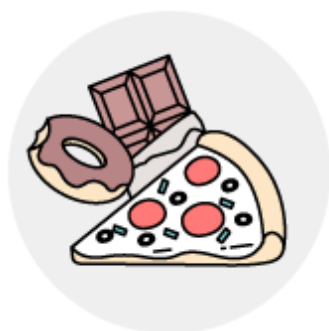
고염, 고지방 식이