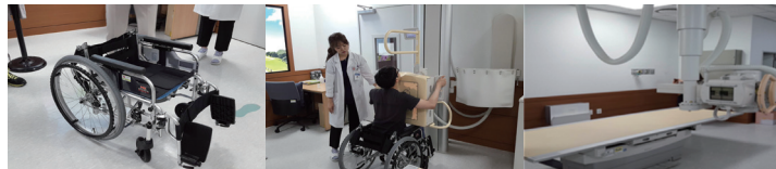
등받이가 접어지는 휠체어 등받이가 접어지는 휠체어를 사용한 흉부촬영 예시 누워서 찍을 수 있는 흉부x-ray